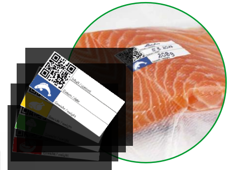
With practical stickers to organize content, date and weight.