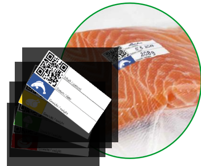
With practical stickers to organize content, date and weight.