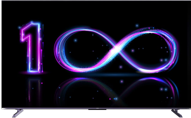
לצפייה במסך SUF958P100